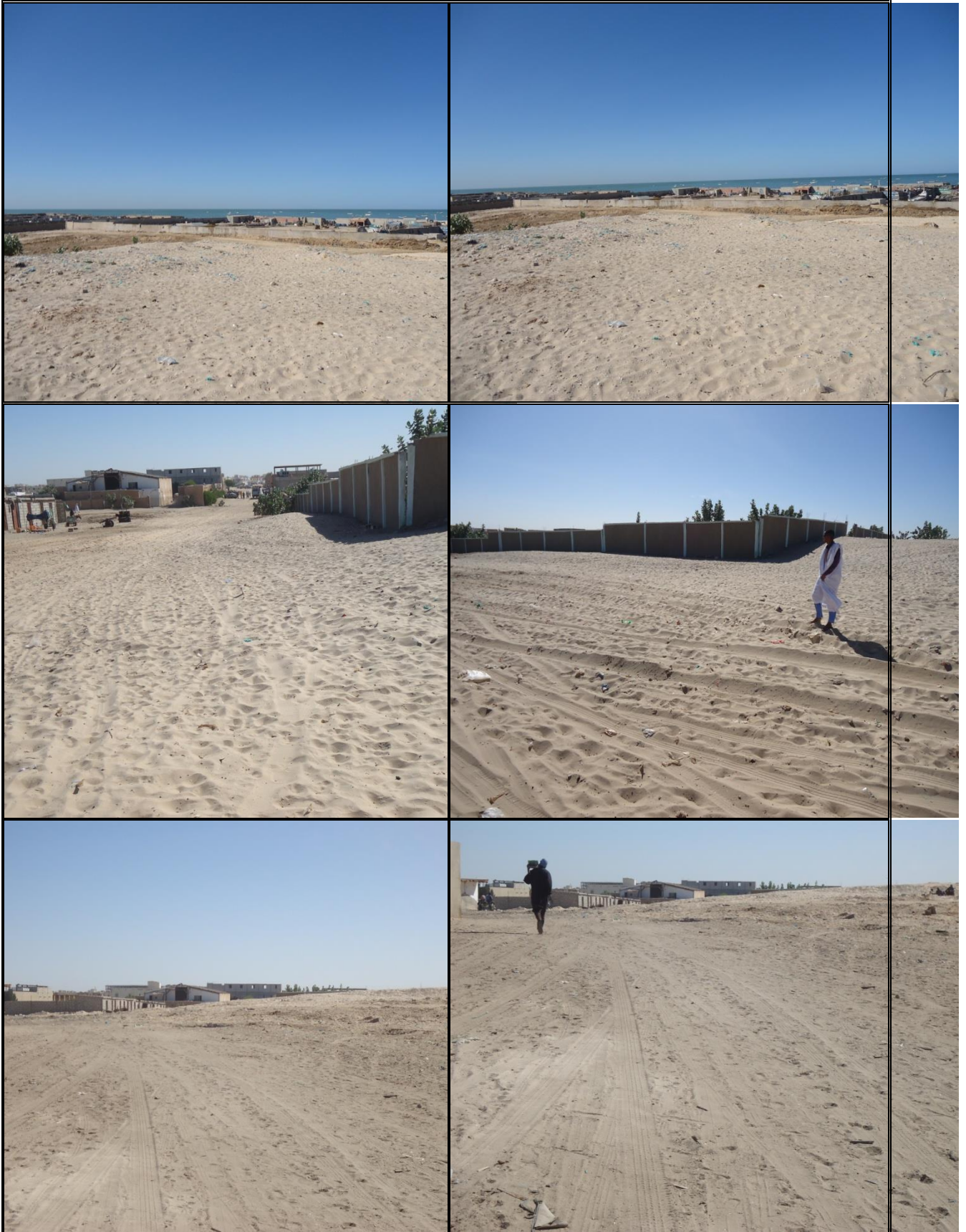
Photos des sites réservés aux infrastructures du PASP avec une vue des espaces publics environnants